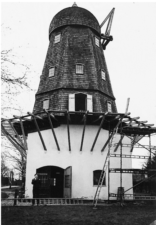
Omgangen under opbygning - 28/11 1981 Vagn C. holder dampen oppe.

Der var nu godt gang i mange aktiviteter, og byggeriet var næsten ophørt. Det