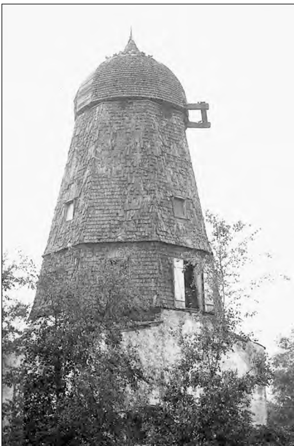
Ganløse Mølle ved overtagelsen 1970

Ja, Møllen er blevet et vartegn for byen, men også en integreret del af byens liv.