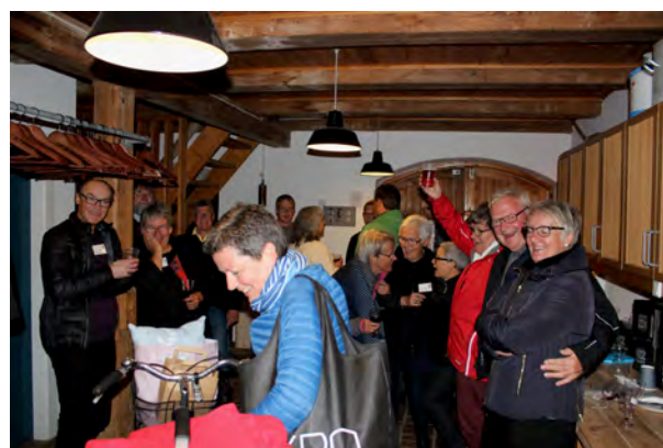
Afslutning af pinsefest 2016