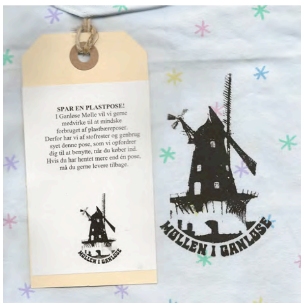
Stofpose lavet af Møllens nørklepiger 2019