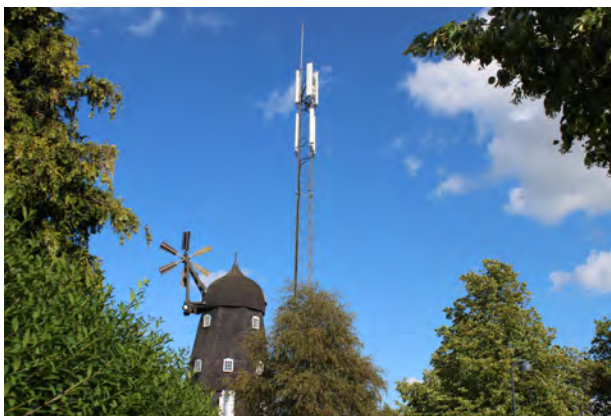
Midlertidig antennemast ved Møllen 2019

Det blev derfor ved den efterfølgende generalforsamling besluttet at påbegynde en årlig opsparring på kr. 50.000, så