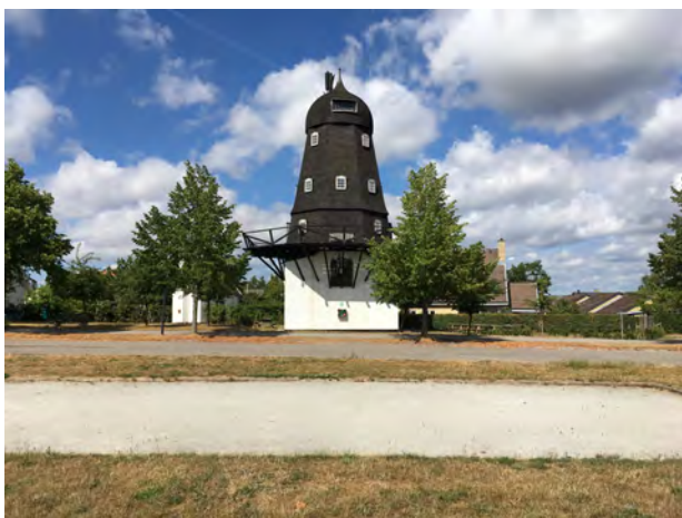
Ganløse Mølle den tørre sommer 2018

I 2010 blev hatten malet. Jens møllebygger vurderede i den forbindelse, at