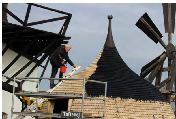
Jens møllebygger maler de nye spån marts 2020

ner. Restriktionerne blev iværksat efter at også Danmark blev ramt af en verdensomspændende corona-pandemi. Restriktionerne betød, at bestyrelsen besluttede at lukke Møllen for alle aktivi-