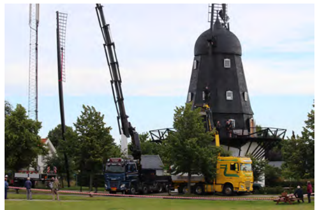
Den anden vinge løftes på plads