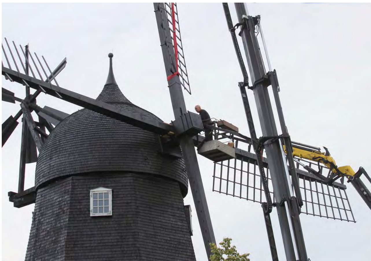
Den anden vinge fastgøres

Det blev en storslået dag. Vejret var fra morgenstunden perfekt - solskin og ingen vind. Og selv om der hen ad dagen blev overskyet, klarede det hen på eftermiddagen op igen, og Ganløse mølle kunne nu rigtig bryste sig af sine nye vinger. Mange Ganløserere benyttede det dejlige vejr til om aftenen at gå en tur op