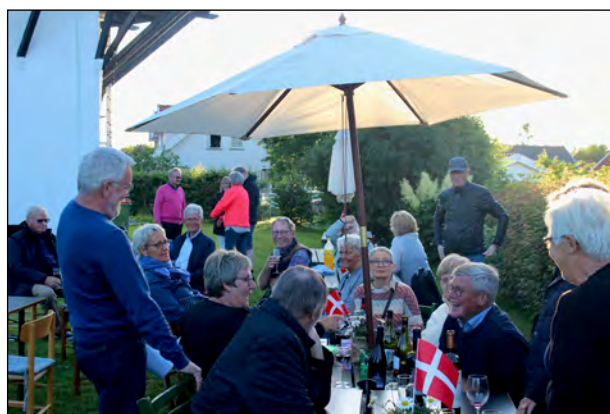
Møllens "gamle", 22. juni 2020