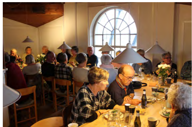
Lørdagsfrokost januar 2015

Lørdagsfrokosten er fortsat det centrale element i møllelivet. Men i 2010 foreslog nye medlemmer, at lørdagsfrokosten skulle flyttes fra lørdag kl. 12 til søndage. Selv om det for mange af de gamle medlemmer blev betragtet som blasfemi, blev det besluttet i en prøveperiode at afholde lørdagsfrokoster søndage kl. 13. Året efter fortrød man, og frokosten blev flyttet tilbage til lørdage med spisetid kl. 12:30 som et levedygtigt kompromis.