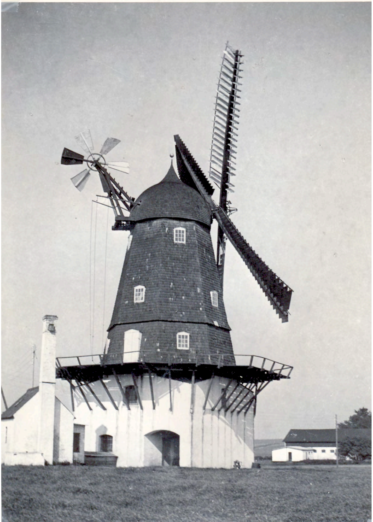
Ganløse Mølle 1937