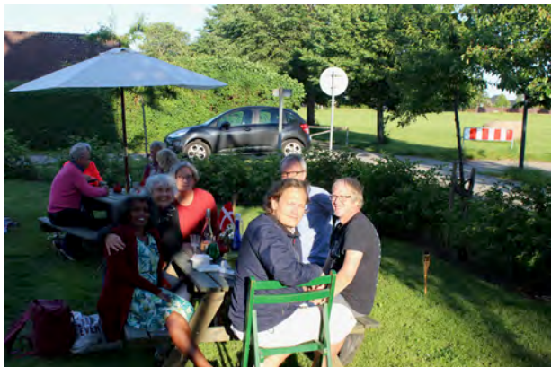
Møllens "unge" 22. juni 2020

mange omkringstående tilskuere fik den 6 tons tunge hat bakset på plads i den stride blæst, manglede han fortsat at få fabrikeret vingerne på sit værksted i Faxe Ladeplads. Og den slags håndværk tager den tid, det tager.