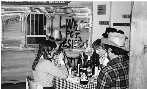
Et kig ind i banken efter lukketid....

Jævnligt var der filmaften. Formodentlig viste man samtlige Bergmann-film foruden en række andre kvalitetsfilm, som Oprør i Ådalen m. fl. At det kunne se lidt mystisk ud udefra, kunne dog også