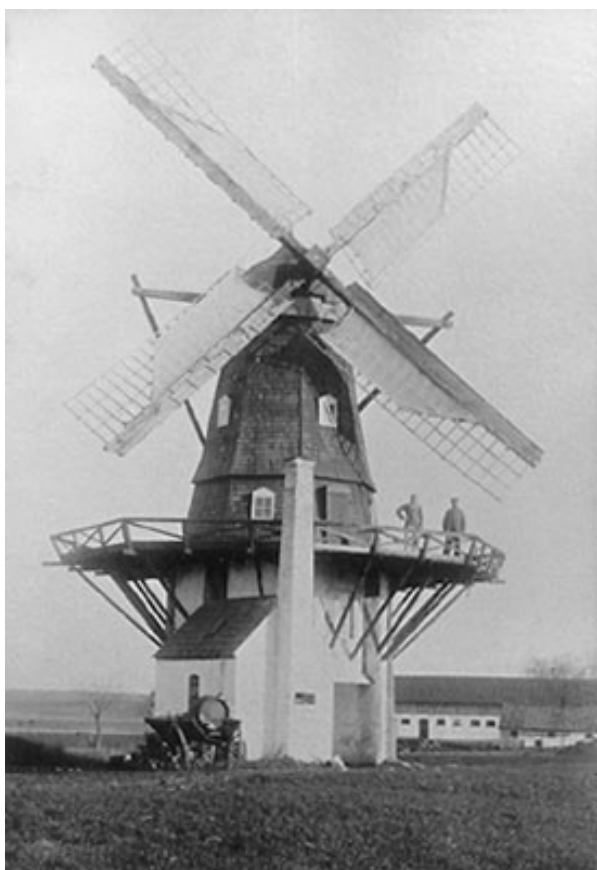
Ganløse Mølle 1905