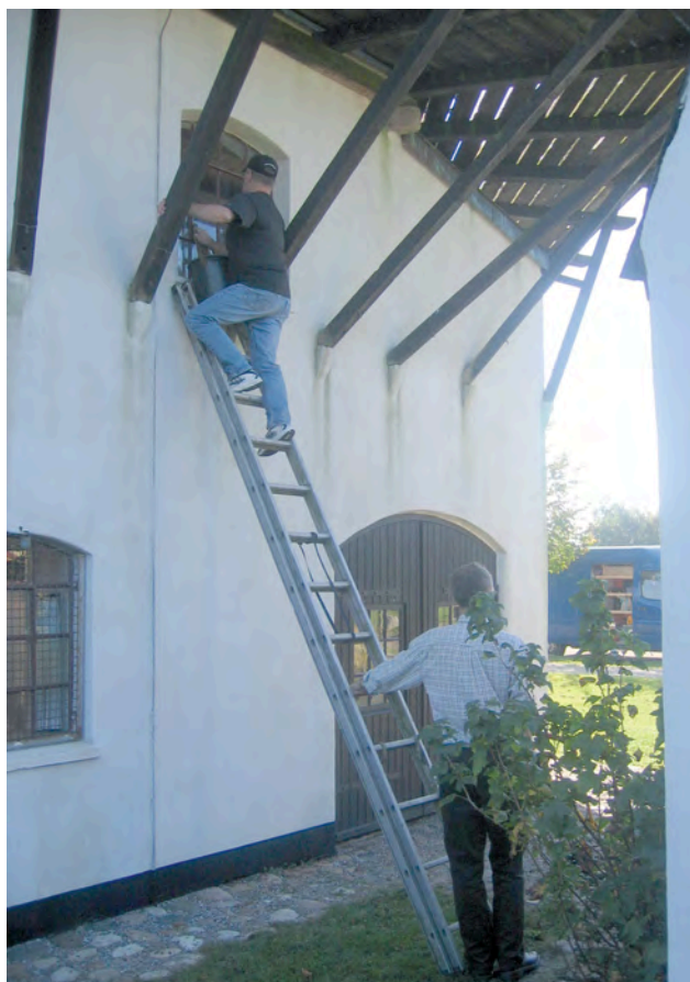
Arbejdslørdag 2006. Formanden pudser vinduer

ber om de økonomiske betingelser for opsætning af antenner i Møllen. Samtidig blev ønsket fra Ganløses Borgergruppe (hvor flere møllemedlemmer var særdeles aktive) om at undgå nye grimme stålmaster til mobilantener i Ganløse, indirekte tilgodeset. Der var således skabt baggrund for at såvel de ”forretningsorienterede” som de ”naturbevarelsesinteresserede” medlemmer af Møllen kunne stå sammen om at støtte forslaget om at Møllen sagde ja tak til antenner i hatten. Mod en passende økonomisk kompensation, forstås. Møllen, der var etableret med tanker på genopbygningen og det sociale samvær, også kaldet ”Mølleånden”, var nu blevet en forretning med delvis finansiering gen-