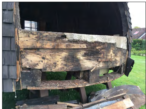
Den gamle "Bjørn" - repareret med beton i 1971

TDC opstillede en midlertidig antenne-mast ved siden af Møllen, så antennerne kunne flyttes ud af hatten i god tid inden