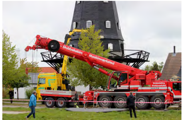
Klar til løft af hatten, maj 2020

juni 2020 var dagen, hvor Møllen i Ganløse kunne fejre sit 50-års jubilæum, og at vi i den anledning så frem til at kunne