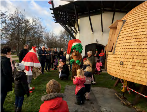
Jul for børn ved Ganløse Mølle julen 2019