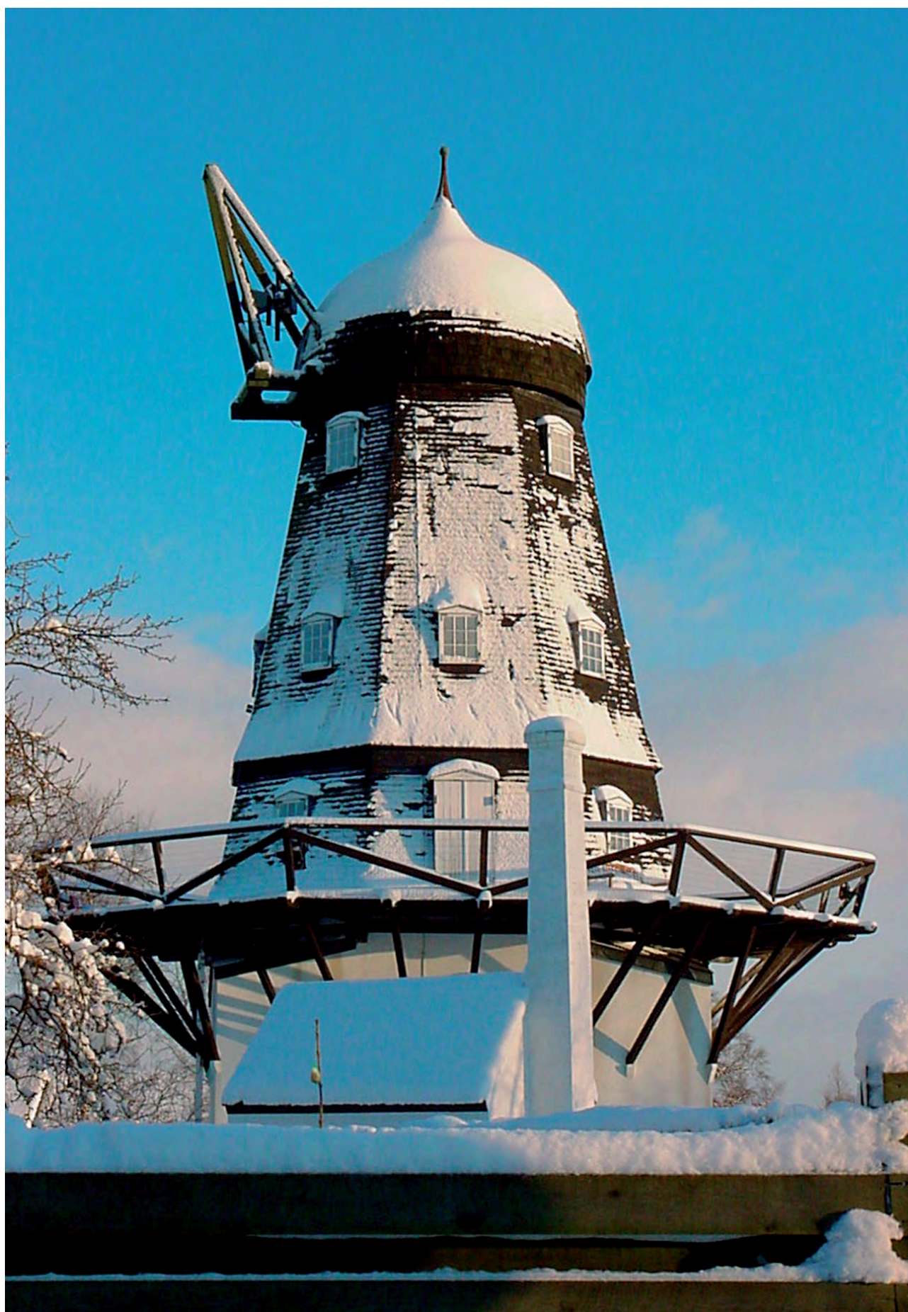
Dagen efter en kraftig vinterstorm