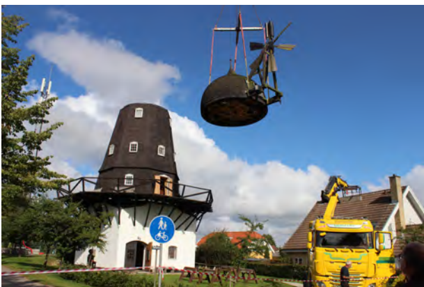
Hatten ned - august 2019

I takt med, at udløbsdatoen for hatten nærmede sig, opstod der blandt nogle