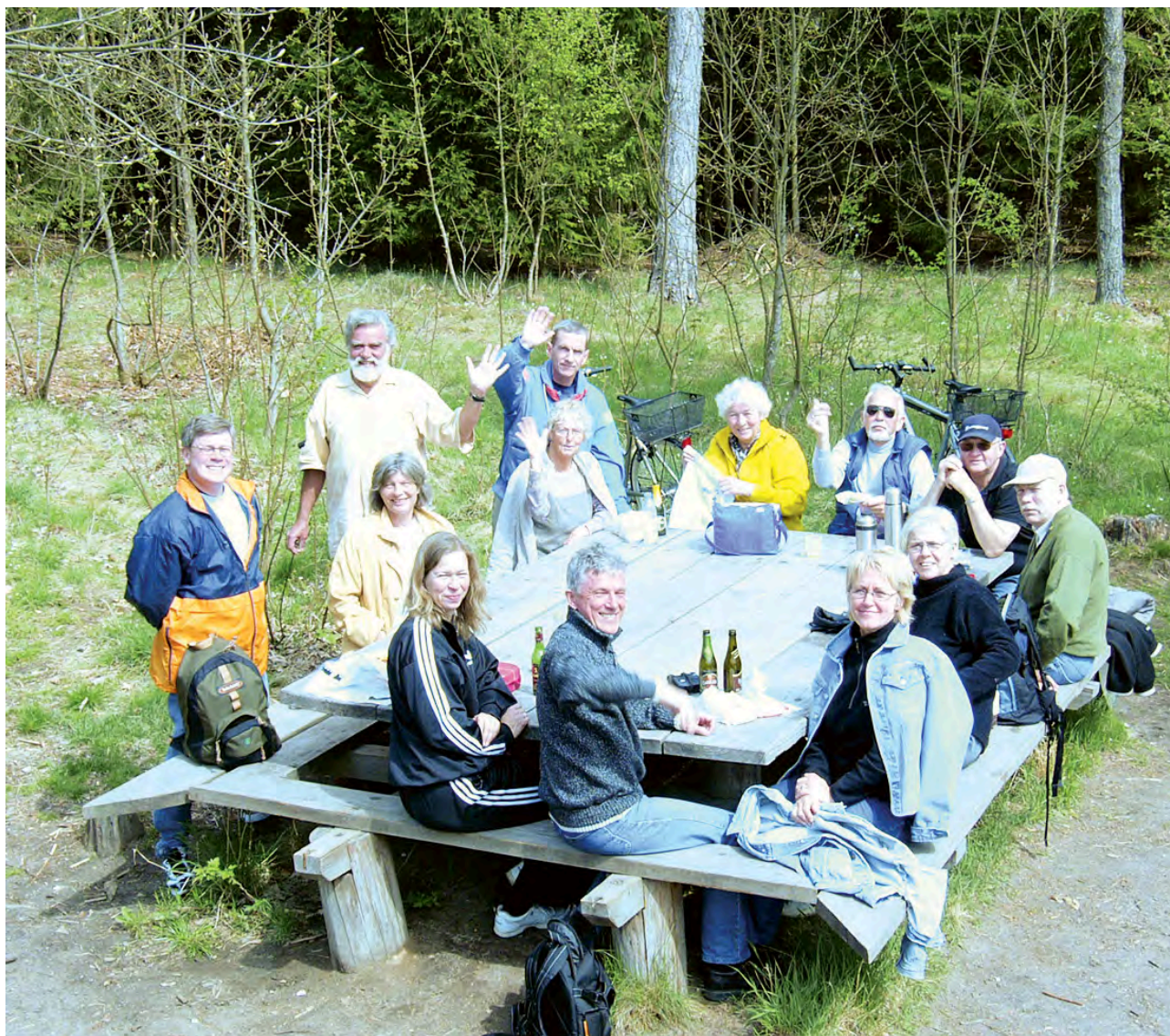
Cykeltur maj 2005

Den første forespørgsel om opsætning af antenner i møllehatten kom fra Tele Danmark Mobil i 1997. I en lokalplan for Ganløse Bymidte vedtaget af Stenløse Byråd den 17. december 1997 var Ganløse Mølle blevet udpeget som placeringsmulighed for mobiltelefoniantenner. Og hermed var vejen banet for Møllens forhandlinger med teleselska-