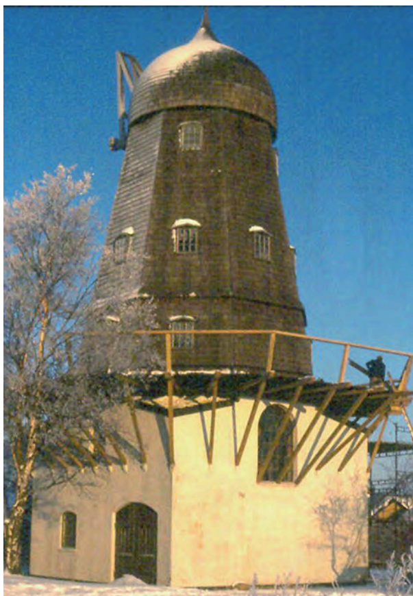
Møllen får en omgang 1981

med sammenkomsten ikke blot skulle handle om at spise og drikke. Festerne havde som regel et tema, og der var næsten altid levende musik, ofte jazz, men også optræden af forskellig art.