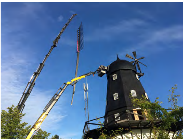
Den første vinge løftes på plads