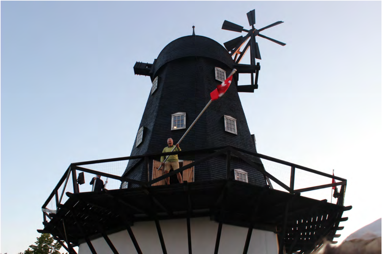
Flaget tages ned 22. juni 2020