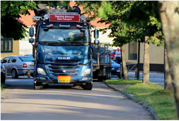
Vingerne ankommer fra Faxe Ladeplads 10. juli 2020