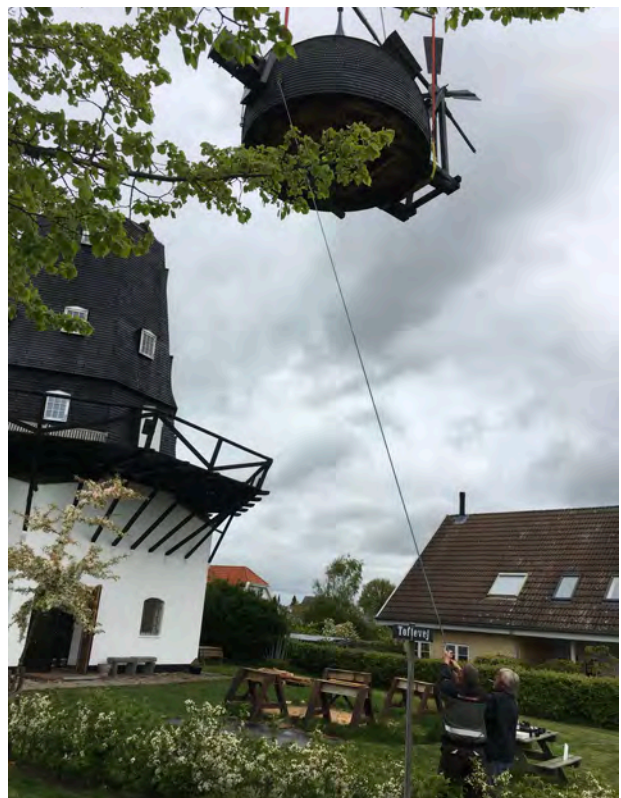
Møllehatten sættes op maj 2020

præsentere Ganløse by for den fuldt færdigrenoverede mølle med vinger på. Da hatten kom på plads på toppen af den nymalede møllekrop den 15. maj så det ud til, at den tidsplan nok kunne holde.