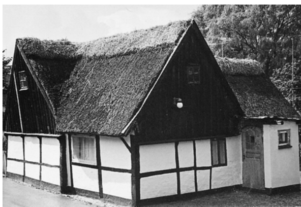
Gammelt håndværkerhus i Ganløse: "Skomagerhuset" I 60erne holdt en frisør til her.

De første udstykninger skete fra Dyrehavegård omkring 1957, og de første parcelhuse skød op ved Dyrehavegårdsvej og Ganløseparken. Selve gården lå der, hvor gårdhavehusene, Ganløseparken 2, ligger i dag, bagved Pirolen.