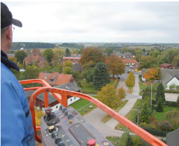
Møllehatten males. Udsigt over Ganløse mod vest, 2003