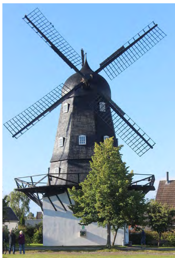
Ganløse Mølle 2020