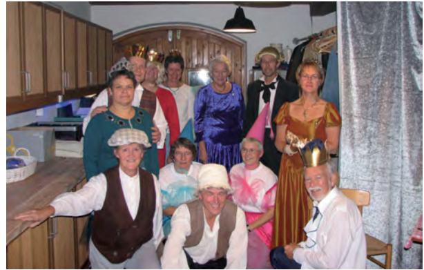
H.C.Andersen festudvalget 2005: