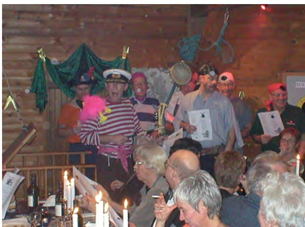
Underholdning af mandemadsholdet 2006