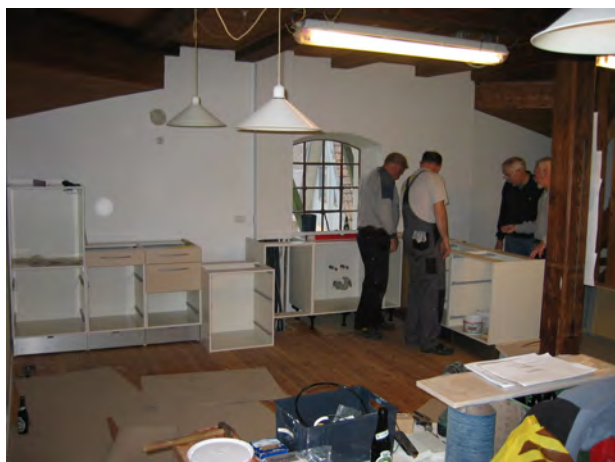
Nyt køkken januar 2008.

Der var fortsat problemer med utætheder omkring staværet, og ofte lå der vand på gulvet på hatteloftet efter kraftig regnvejr. Jens møllebygger, der har været vor faste vedligeholdelseskonsulent siden midten af 90'erne, blev i 2008