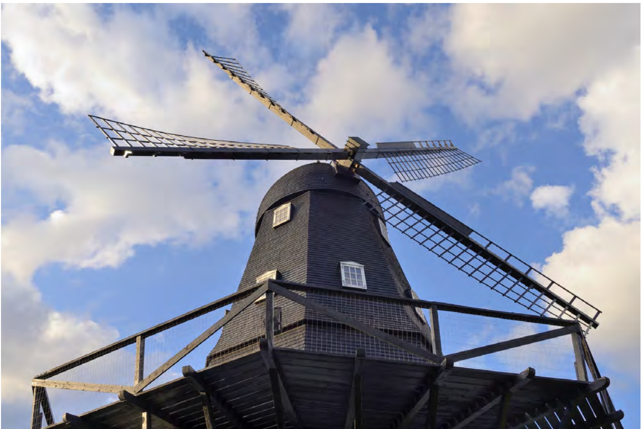
Ganløse Mølle 10. juli 2020