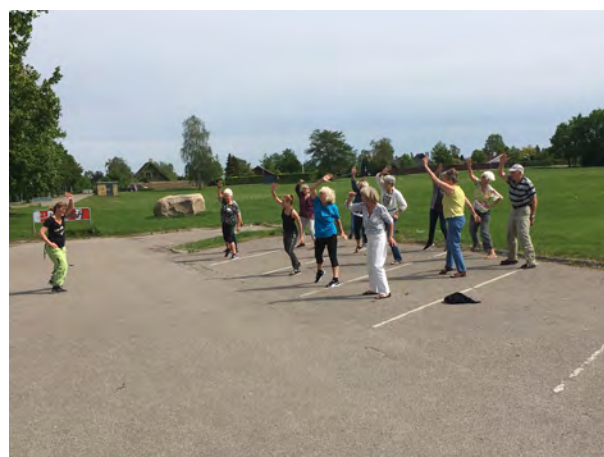
Zumba ved pinsefest 2017

Som led i den nye strategi startede man i 2015 en tradition med pinsefest ved Møllen. Den blev afholdt pinselørdag med bandet ”Gang i Gaden”, der var mede op til festen. Men desværre var vejret ikke med os. Arrangementet var slået stort op med zumba, fodboldturnering mellem grundejerforeninger, petanqueturnering, fællesspisning dans til DJ i teltet om aftenen. Men man ramte