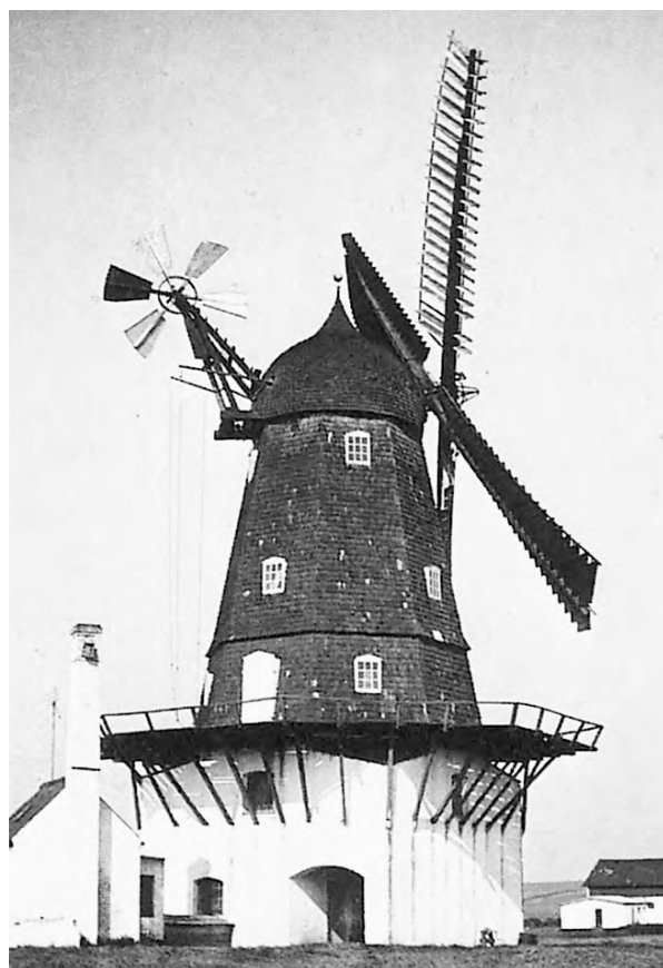
Ganløse Mølle 1937