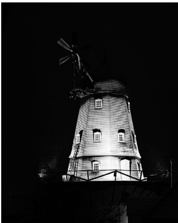
Sneklædt Ganløse Møllen januar 2014

“Ganløse Mølle får ny hjemmeside. Adressen er den samme, nemlig www.ganloesemoelle.dk , men det primære formål er ændret.