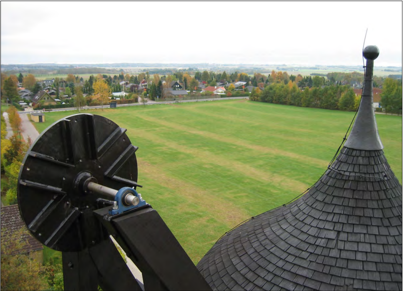
Møllehatten males. Udsigt over Ganløse mod vest, 2003

nemlig at fremstilling, levering og opsætning af nye tujaspåner mv. på ”mølleskroget” (kunne han dog ikke have anvendt et andet ord!?) ville koste 124.600 kr. plus moms. Hvor skulle man skaffe de penge fra?