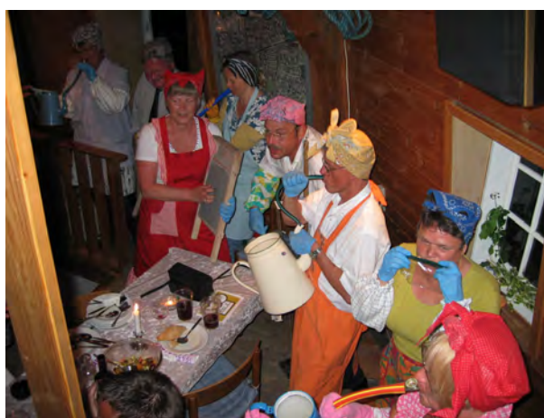
Køkkenfest maj 2008