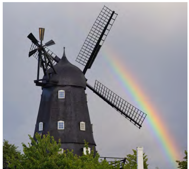
Så er vingerne monteret

Mølle. En særtransport med de to 18,5 meter lange vinger ankom til Ganløse allerede før kl. 6 om morgenen, da Jens møllebygger gerne ville have fred til