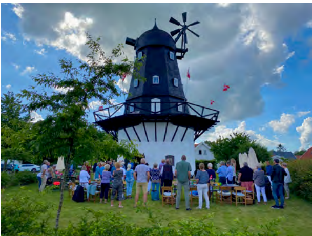
Møllemedlemmer samlet til Jubilæumsfest 22. juni 2020