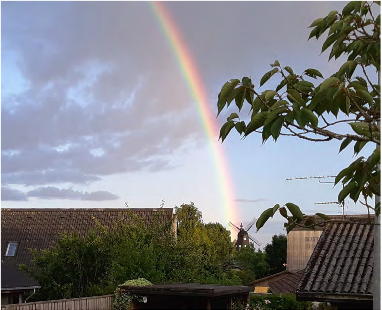
Samme dag som de nye møllevinger var monteret på Møllen, viste naturen om eftermiddagen, hvor tilfreds den var med resultatet.