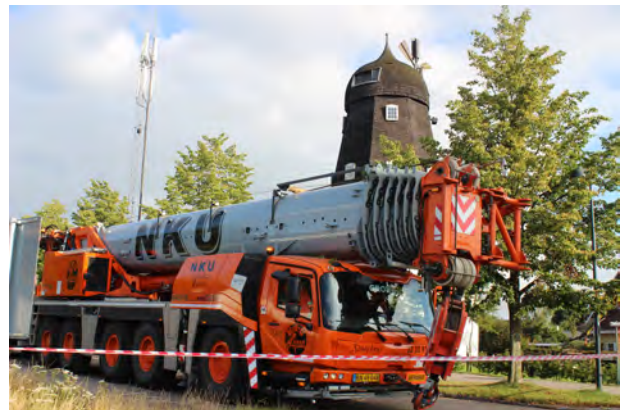
Kæmpekranen, der løftede hatten af august 2019

møllemedlemmer den ide, at man i forbindelse med renovering af hatten kunne sætte vinger på Møllen. Der var ikke umiddelbar tilslutning til en sådan "udskejlse". Synspunkterne var, at Ganløse Mølle er jo netop karakteriseret ved ikke