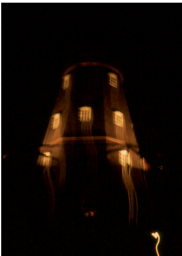
På vej hjem. Ca. år 2000